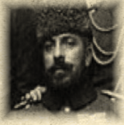
Vehip Paşa "KAÇI" (15. Kolordu Komutanı)