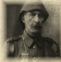
Esat Paşa “BÜLKAT” (3. Kolordu ve Arıburnu Kuzey Grubu Komutanı)