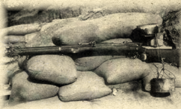
Çanakkale Savaşlarında düşmanın çekiliş sırasında kullandığı hilelerden.Belli aralıklarla patlayan tüfek düzeneği

Devletleri götüremedikleri malzemeleri canlı, cansız ayırmaksızın imha etmiştir. Bu planı hazırlamada emeği geçen komutanlardan Kurmay Albay Aspinall'in "Allah'ın ilk defa cephenin boşaltılması sırasında İngilizlerin tarafını tuttuğunu" söylemesi de durumu özetleyen anlamlı bir ifade olmuştur.