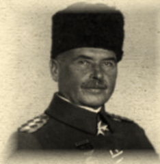
Liman Von SANDERS (5. Ordu Komutanı)