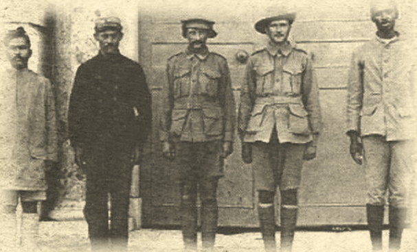
Çanakkale Savaşlarında Türklere karşı savaşırken esir düşmüş müttefik kuvvetleri askerleri

Çanakkale Savaşları'na katılmak üzere Mısır'da toplanmaya başlayan İtilâf Devletleri ordusu, değişik etnik ve dinsel kökenden gelen askerlerle rengârenk bir görüntü sergilemişti.