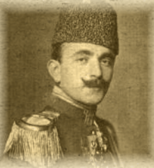
Enver PAŞA (Harbiye Nazırı, Başkomutan Vekili)

Çanakkale Savaşları sırasında Osmanlı ordularının komuta heyetinin önde gelen komutanlarını şöyle sıralayabiliriz.