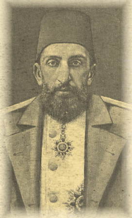
SULTAN II ABDÜLHAMİD (1842 - 1918)

Dünyanın en büyük donanmasına sahip İngiltere ve Fransa Çanakkale önlerine geldiğinde İstanbul'un boşaltılması gündeme gelmişti. Beylerbeyi Sarayı'nda kahır ve ümitsizlik içinde olan II. Abdülhamit, Talat Paşa tarafından kendisine tebliğ edilen son derece nahoş karara, kendine yakışan harika bir cevap vermişti.