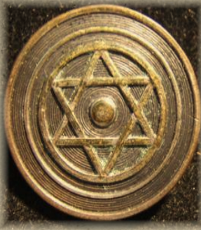
Zion katır alayının amblemi

Çanakkale Savaşında Yahudi Mülteci Katır Bölüğü, Suriye ve Filistin'deki mülteci Yahudilerden kısa sürede oluşturulmuştu. Ağırlıklı olarak Rusya kökenli bu insanlar Mısır'a, yaptıkları casusluk faaliyetleri nedeniyle Osmanlı devletinden kaçmak ve güvende olmak için gelmişlerdi. Ze'ev Jabotinsky ve Joseph Trumpeldor isimli iki Siyonist lider mülteci kamplarındaki Osmanlı düşmanlığı potansiyelini kullanarak bir Yahudi lejyonu oluşturmaya karar verdiler Amaçları bu lejyonu Türklere karşı itilaf güçlerinin yanında savaştırıp İsrail'i kurmak için İngilizlerden yardım almaktı. Askeri birlik fikri İngilizler tarafından reddedilince bir katır bölüğü oluşturulmasına karar verildi.