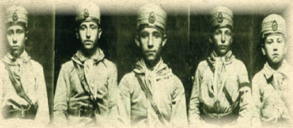
Çanakkale’de şehit olan öğrenciler

Çanakkale Savaşları’nda yaşanan kayıplar, Türk milletine çok pahalıya mal olmuş, en fazla ihtiyacı olduğu bir dönemde Türk milleti binlerce okumuş aydın evladını bu savaş sonucunda kaybetmiş, bunun acılarını ve olumsuzluklarını yıllarca üzerinden atamamıştır.