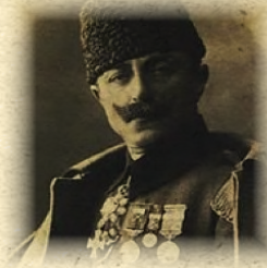
Cevat Paşa "ÇOBANLI" (Çanakkale Boğazı Müstahkem Mevkii Komutanı)