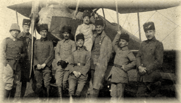
Çanakkale 15.Harp Tayyare Bölüğü

Bu kadar ilkel metotlarla da olsa, uçaklar Çanakkale Savaşında çok işler başarmışlardır.