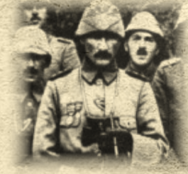
Mustafa Kemal "ATATÜRK" (19. Tümen Komutanı - Anafartalar Grubu Komutanı)