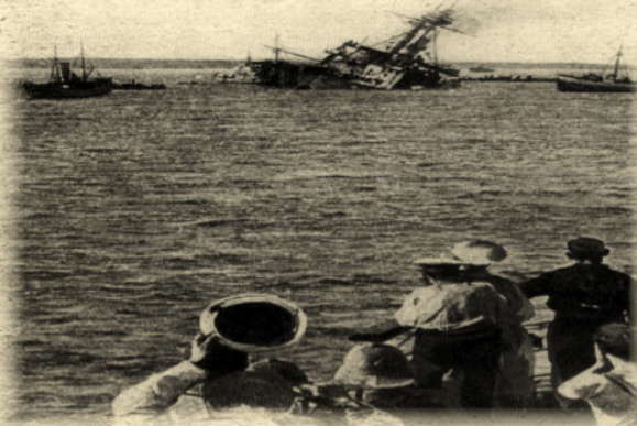
MAJESTIC Zırhlısı Alman denizaltısı tarafından torpillendikten hemen sonra batarken...

I. Dünya Savaşı sırasında Osmanlı Donanması'nın elinde üç denizaltı bulunuyor olmasına rağmen, bu denizaltılar aktif olarak savaşa katılmamışlardır. Bu yüzden devletin hiç bir zaman bir denizaltı gücü olmamıştı. Çanakkale Muharebelerinde İtilaf Devletleri'ne ait 13 denizaltı kullanıldı ve Çanakkale Boğazı'nı 27 kez geçme girişiminde bulunuldu. Bu girişimlerde 3 İngiliz denizaltısı ( E - 7 , E - 15 ve E - 20 ), 3 Fransız denizaltısı ( Joule , Mariotte ve Saphir ) ve bir Avustralya denizaltısı ( A - E2 ) batarken, Fransız denizaltısı Turquoise Osmanlı kuvvetleri tarafından ele geçirildi ve I. Dünya Savaş'ının sonuna kadar Müstecib Onbaşı ismi ile Haliç'te alıkonuldu. Savaşın sonunda Fransa'ya iade edildi. Osmanlılar İtilaf Devletlerinin denizaltılarına karşı gözetleme postaları, boğazı mayınlamak ve denizaltı ağ engelleri ile önlemler almaya çalışmıştır. Çanakkale Boğazı ve Marmara Denizi'nde yürütülen denizaltı harbinde İtilaf Devletleri, doğrudan Osmanlı ve Alman gemilerine, dolaylı olarak 5. Ordu'nun lojistik desteğine ciddi kayıplar verdirdi. Bununla birlikte asker nakliyatı Mayıs ayı ortalarından itibaren Trakya üzerinden kara yoluyla yapılmaya başlandı. Müttefik denizaltı operasyonları cephe kuvvetlerinin ikmalini zor, zahmetli, zaman alıcı